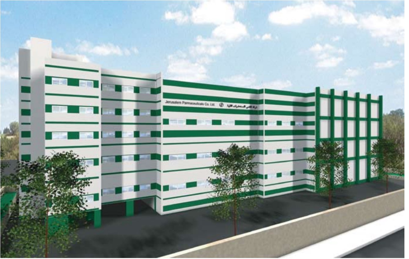
شركة القدس للمستحضرات الطبية - البيرة