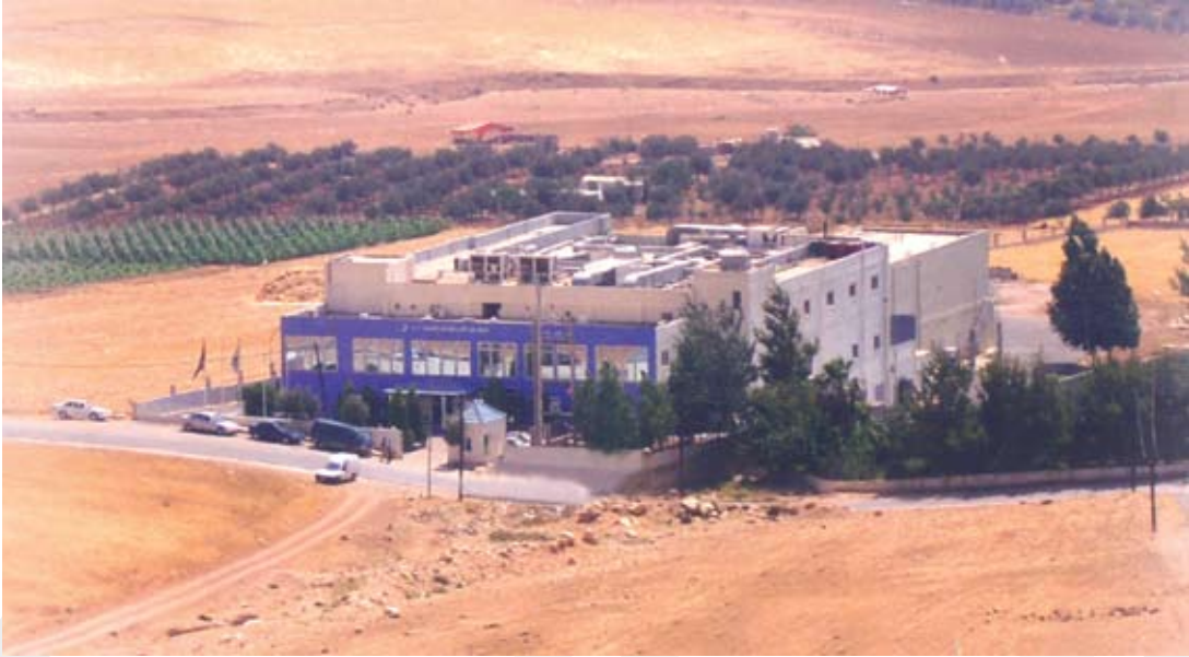
شركة نهر الأردن للصناعات الدوائية - الأردن