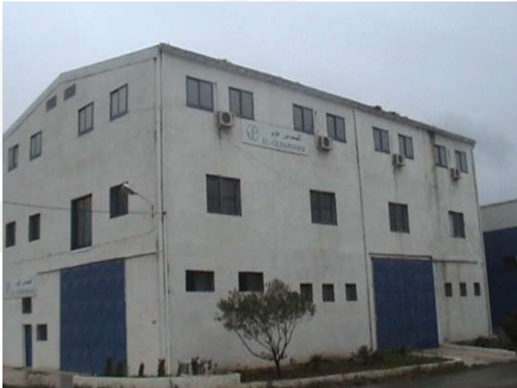
شركة القدس فارم - الجزائر